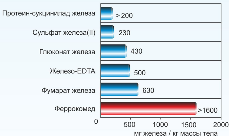
Рис. 3. Токсичность препаратов железа при введении внутрь

8. Феррокомед относится к безвредным препаратам (рис. 3).